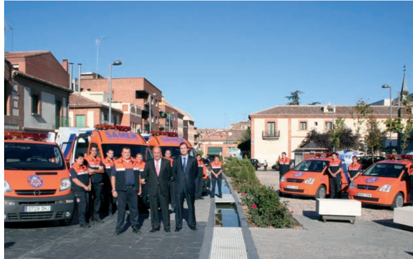
De izquierda a derecha, el Jefe de SAMER Protección Civil, el Alcalde de Las Rozas y el Concejale de Seguridad y Tráfico; tras ellos, el equipo humano de los nuevos vehículos

Por último, el coche de transporte de grupos puede trasladar hasta nueve personas, ofreciendo la posibilidad de acoplar unas jaulas para el transporte de cuatro perros adiestrados para la búsqueda de personas desaparecidas.