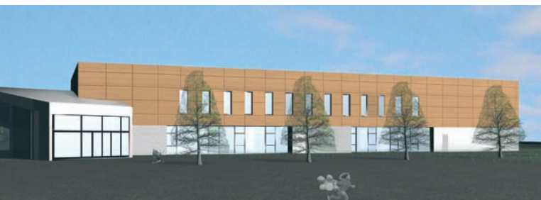
En las imágenes puede observarse el aspecto exterior del Polideportivo tras la reforma

El proyecto de remodelación consistirá en la supresión de las dos piscinas descubiertas (de verano), y en su lugar la construcción de dos nuevas piscinas más amplias , una de aprendizaje (para bebés y aquaerobic, de 14 x 10 m) y otra de 6 calles (de 25 x 14); éstas irán cubiertas con una estructura corredera que permitirá disfrutarlas tanto en invierno como en verano.