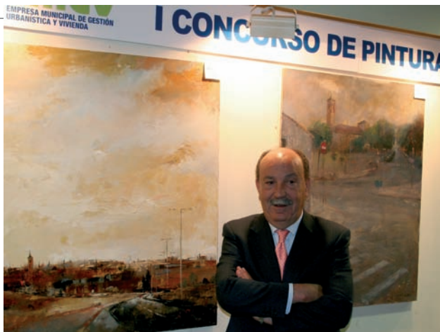
El Alcalde de Las Rozas junto al, de izquierda a derecha, segundo y primer premio

Todos los conciertos darán comienzo a las 20,00 horas, salvo el Concierto de Clausura del VI Concurso Internacional de Piano que lo hará a las 19,30 h.