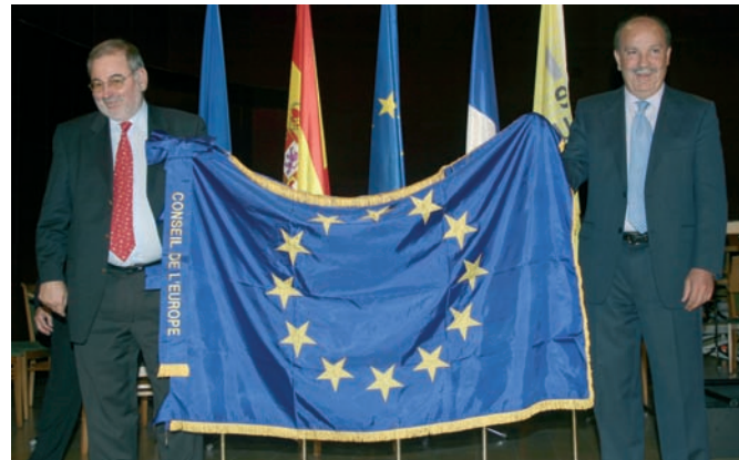
De izquierda a derecha, John Dupraz, parlamentario del Consejo de Europa y Bonifacio de Santiago, Alcalde de Las Rozas

El acto finalizó con la celebración de un Concierto a cargo de la Orquesta Sinfónica Estatal Rusa que interpretó diversas obras de compositores franceses con motivos de inspiración española.