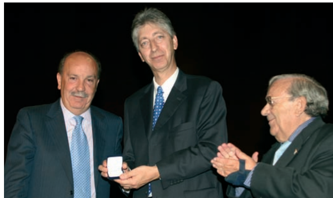
De izquierda a derecha, el Alcalde de Las Rozas, el Alcalde de Villebon recibiendo la Medalla Conmemorativa y el Concejel de Participación y Cooperación de Las Rozas

En Las Rozas, y con las fiestas de San Miguel como marco, se ha instalado una escultura que simboliza la amistad entre los pueblos de Villebon sur Yvette y Las Rozas a través de la representación de dos muchachas, una francesa y otra española, que charlan sentadas en un banco de la calle Real. Esta escultura, obra de Liliane Caumont, está realizada en bronce. En la imagen, la escultora y el fundador.