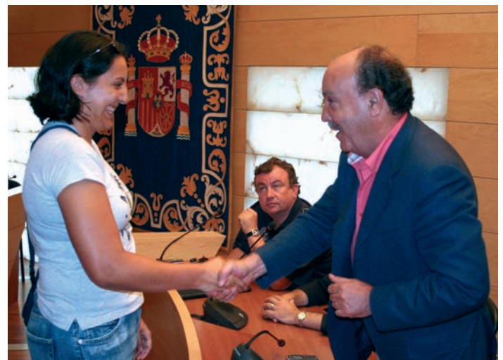
En esta nueva incorporación figuran tres mujeres

La incorporación de estos 40 nuevos agentes eleva el número de efectivos humanos de la Policía Local a 127, lo que sitúa a nuestro municipio en una ratio de 1 policía por cada 500 habitantes, por encima de la media recomendada por la Unión Europea, 1/1.000.