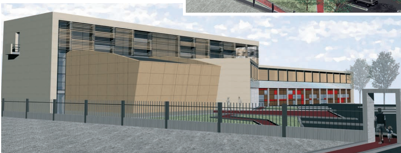
En las imágenes, el proyecto del nuevo Centro de Servicios Sociales en El Cantizal